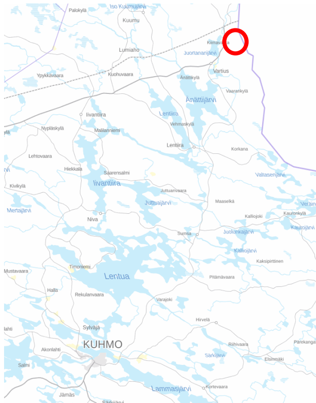
Kuva 1: Suunnittelualueen sijainti (pohjakartta maanmittauslaitos)

Ranta-asemakaava laaditaan Wild Brown Bear Oy:n aloitteesta yhtiön omistamille tiloille sekä metsähallitukselta ostetulle määrälalle. Suunnittelualue sijoittuu Vartiuksen rajanylityspaikan läheisyyteen entisen rajavartioaseman alueelle Erilammen ja läheisten pienten Laukkulampien sekä Aumalampien ympäristöön. Ranta-asemakaava koskee tiloja 290-413-9-14, 290-413-9-15 ja 290-893-11-1 (määräala). Suunnittelualueen pinta-ala noin 44 ha. Suunnittelualueen sijainti ilmenee oheisesta kuvasta 1 ja suunnittelualueen rajaus kuvasta 2.