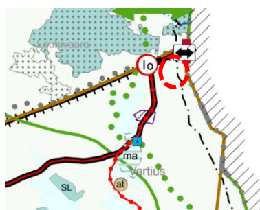
Kuva 3: Ote maakuntakaavayhdistelmästä

Kainuun vaihemaakuntakaavassa 2030 on annettu koko maakuntakaavaa-aluetta koskeva, ranto- jen käyttöä koskeva yleinen suunnittelumääräys: ”Ranta-alueita tulee kehittää viihtyisinä asumisen ja virkistysalueina huomioon ottaen vapaa-ajan, osa-aika- tai pysyvän asumisen tarpeet. Aluei- den suunnittelussa tulee kiinnittää huomiota sähköisten palvelujen saatavuuteen, olemassa olevaan infrastruktuuriin sekä ympärivuotisen käytön edellytyksiin. Yksityiskohtaisemmassa kaavoituksessa tulee ottaa huomioon yleisen virkistyskäytön tarpeet ja vesille pääsyn mahdollisuudet, luonnon- ja maisema-arvot sekä vesi- ja energiahuollon järjestäminen.”