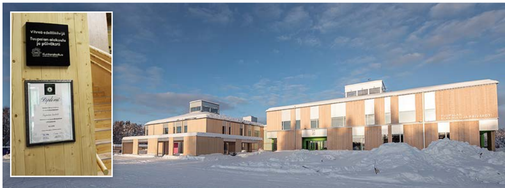
Kuvat: Martti Huusko/Huzza ja Hilikka Komulainen/Kuhmon kaupunki | 2018