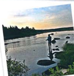
PAJAKKAKOSKI JA SAARIKOSKI

Kalasto: taimen, harjus, säyne ym. Kalastus: vain perho (väkäsetön!) Kosket: Akonkoski Koskialueiden pituus/putous: < 0,5 km/ 1 m Virtaama: 41,2 m 3 /s EKO-KOSKEN KALASTUSSÄÄNNÖT: Kiintiöity kalastajamäärä, vain väkäsetön perho ym.